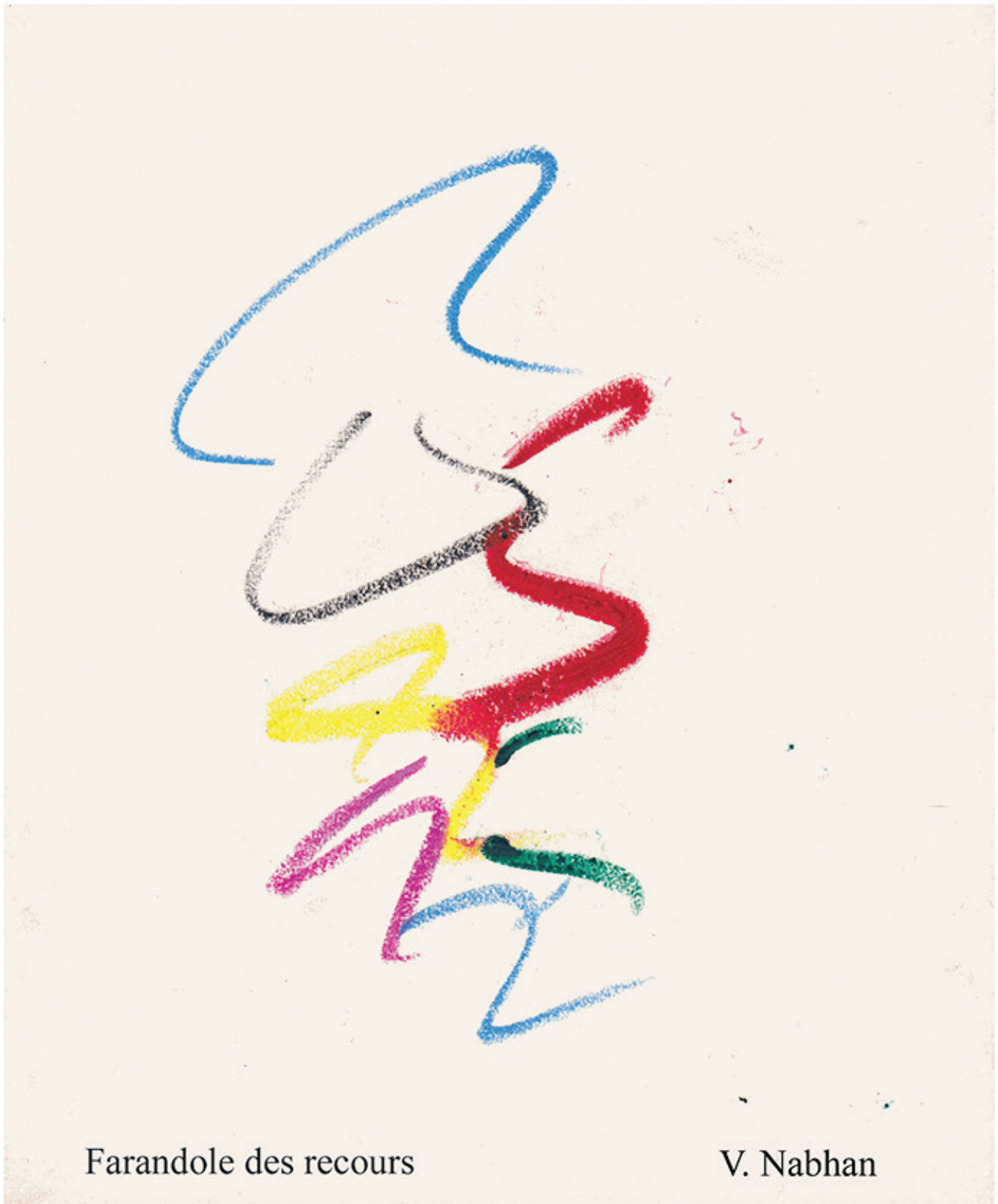
Farandole des recours